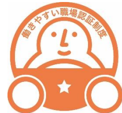
『働きやすい職場認証制度』ロゴマーク