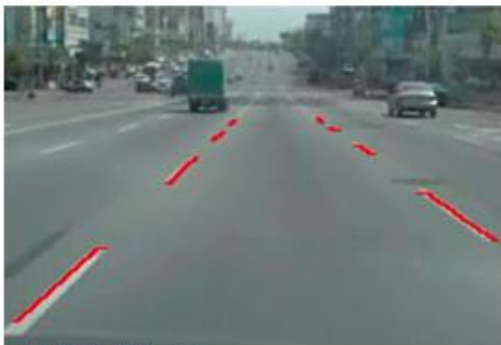
車線認識イメージ